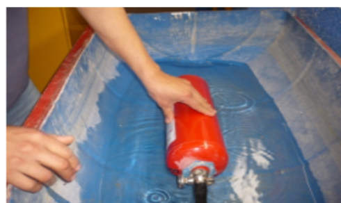
Fotografía 1 y 2. Recipiente empleado para las pruebas de estanqueidad.